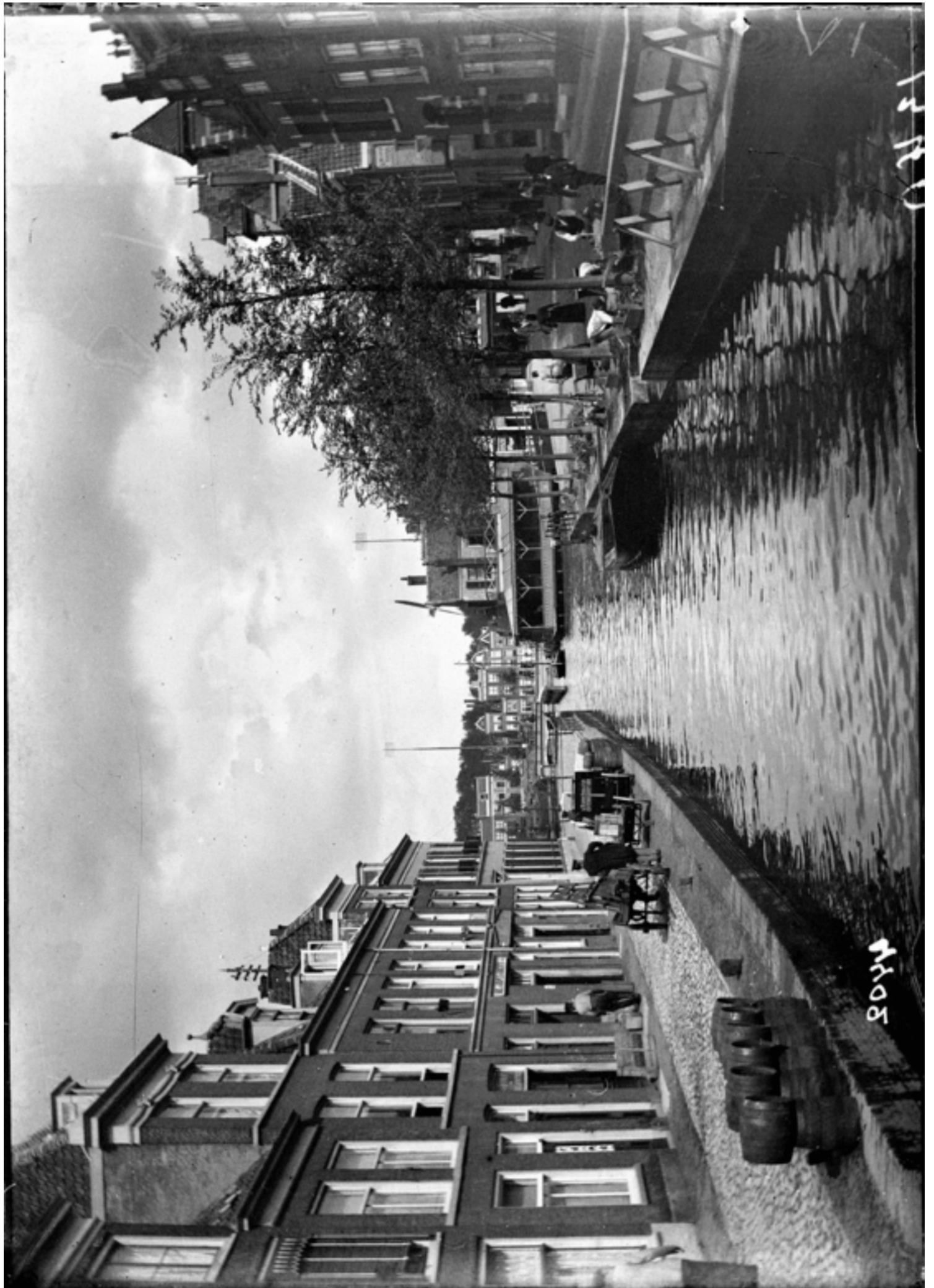
Kort Rapenburg, ca. 1900