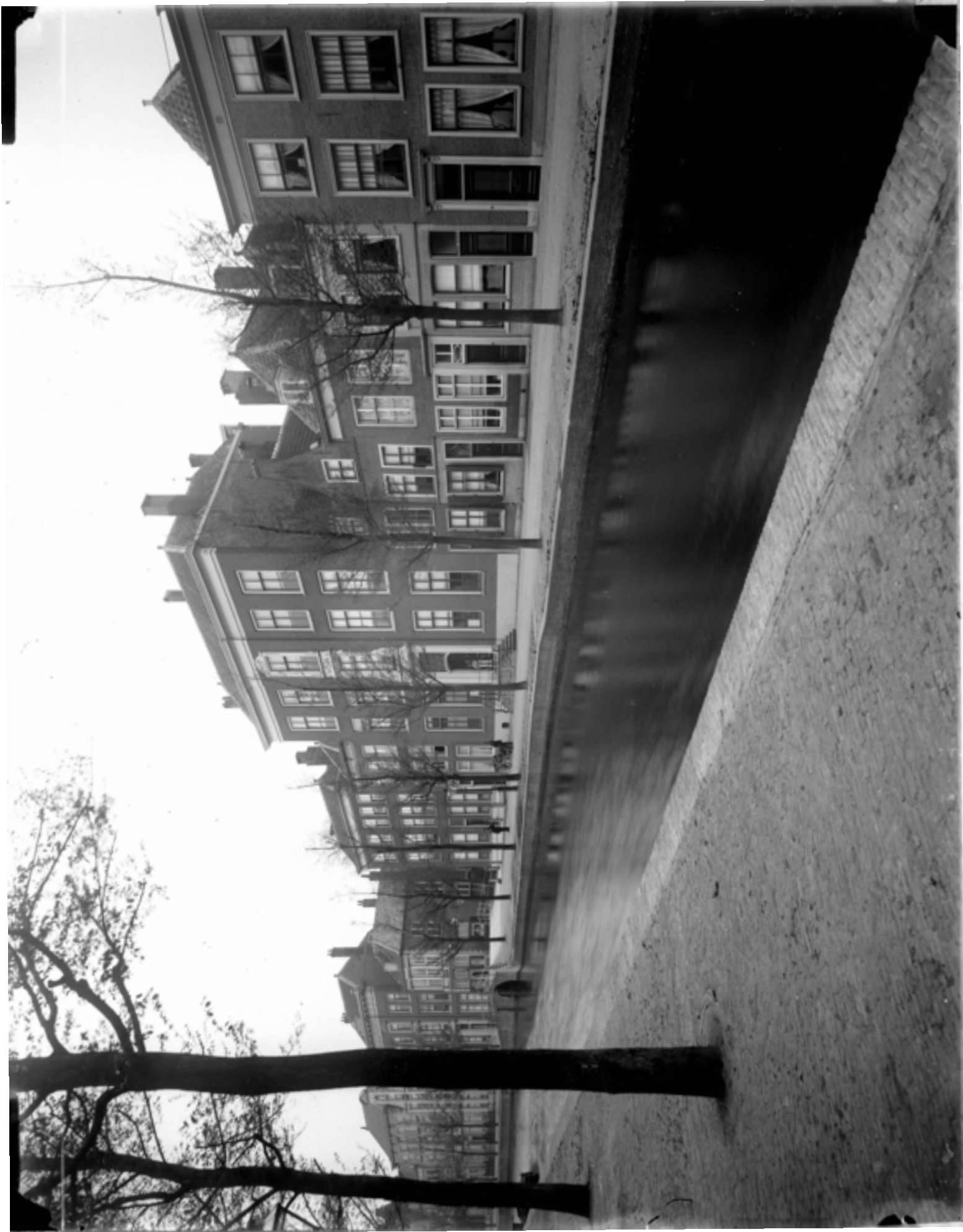
Rapenburg, ca. 1900