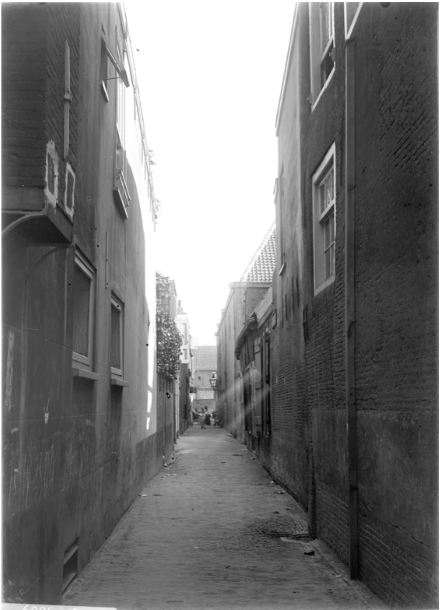
Sliksteeg, ca. 1900