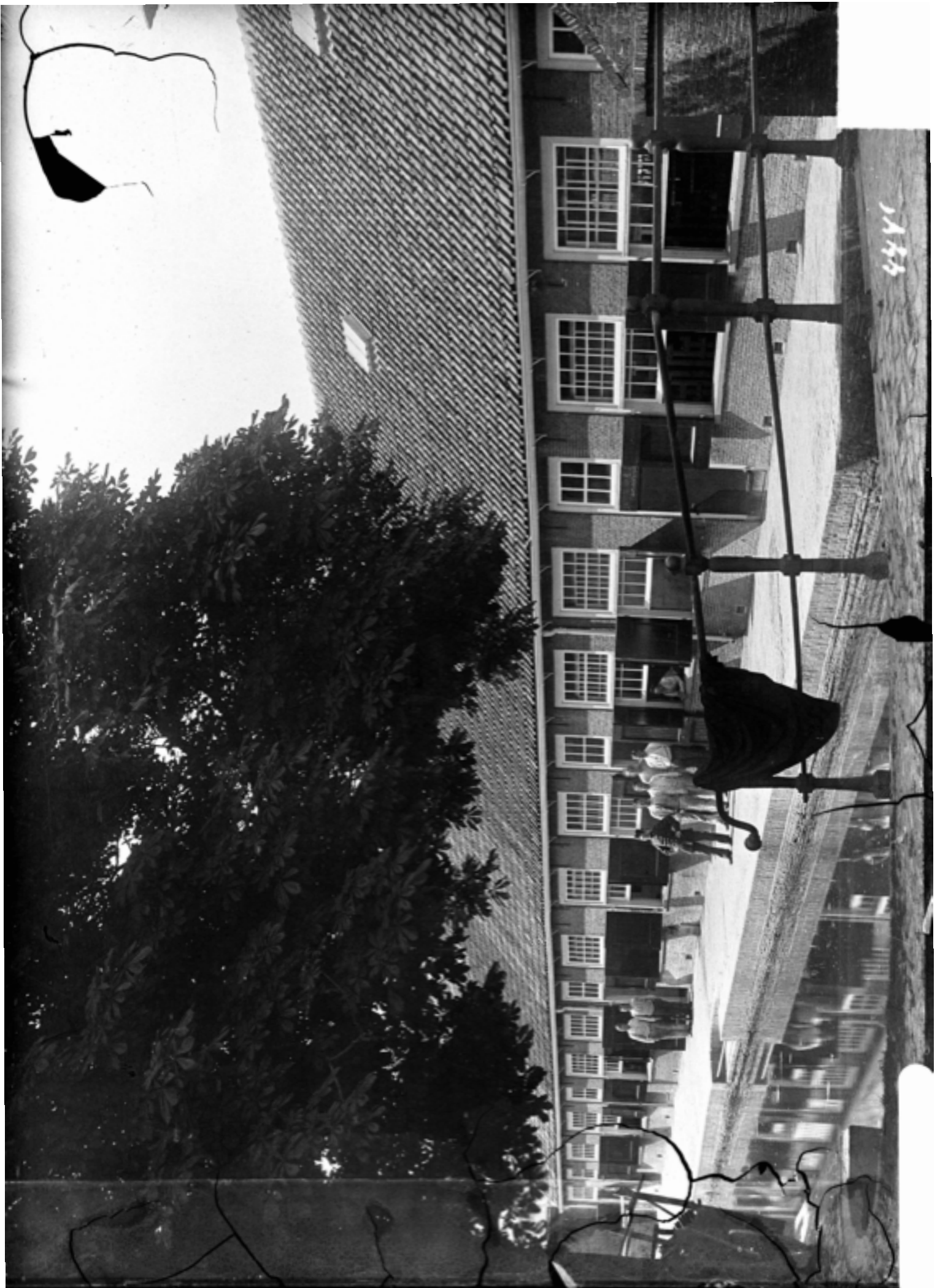
Doelenkazerne, ca. 1900